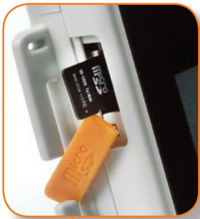
Tarjeta de memoria Micro SD extraíble.